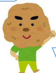
コンテナ いっぱい 採れました！