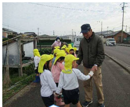
ありがとうございました