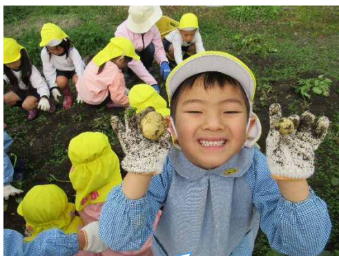
ぼくが見つけたよ！