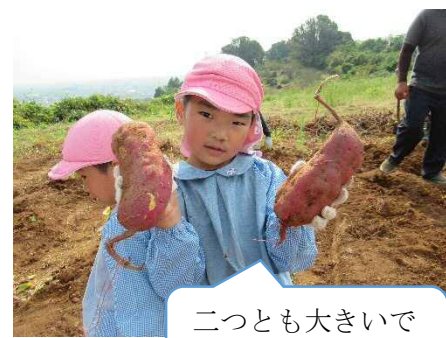
二つとも大きいでしょ！！