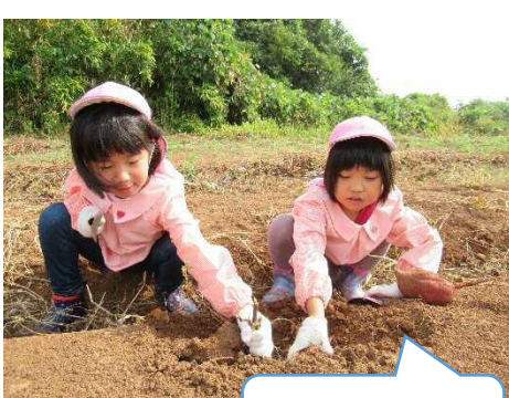
ここに入ってるかな？