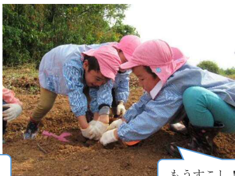
もうすこし！よいしょ！